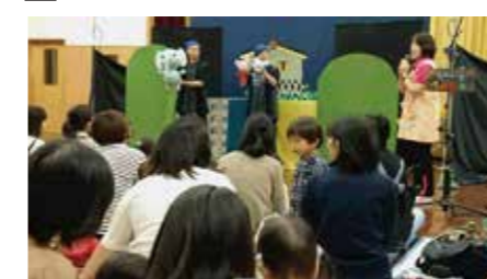
↑10月19日に南交流センターで行われた人形劇「ねずみのよめいり・きとキキキ」