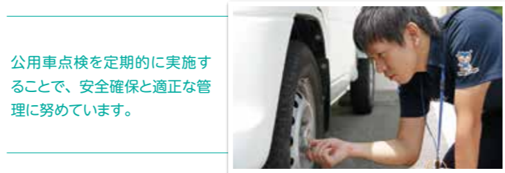
公用車点検を定期的に実施することで、安全確保と適正な管理に努めています。

契約管財課の業務内容は、役場庁舎の管理、 公用車の管理などの管財業務と、公共工事に 係る入札などの契約業務があります。