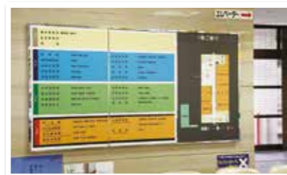
平成 28 年4月に、長与町機構改革に伴い、庁舎内各課案内板を新設しました。

管財業務については、定期清掃、空調設備 点検、電気保安点検、非常用電源設備点検、 エレベータ点検、自動扉保守点検、及び消防 用設備点検などの日常点検を行うことで、役 場庁舎の「安全確保」と「衛生管理」の向上 を図ることにより、町民の皆さまが快適に利 用できるような、役場庁舎の運営に努めてい ます。