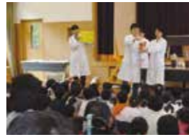
▲8月5日じどうかん劇場 サイエンスショーと科学あそび体験